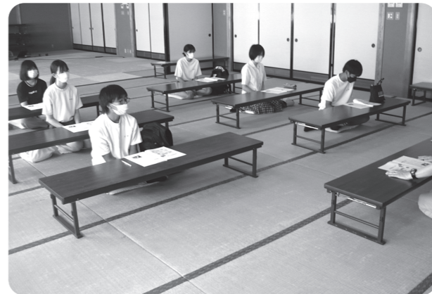
ボランティアについて学习中