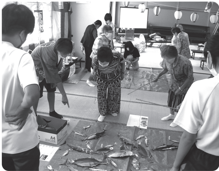
魚釣りゲーム 鯛、ひらめ、マグロなどいろいろな魚がいます

みんなで部屋の飾り付けや、昼食の準備をして、ゲームもすることができて楽しめました。