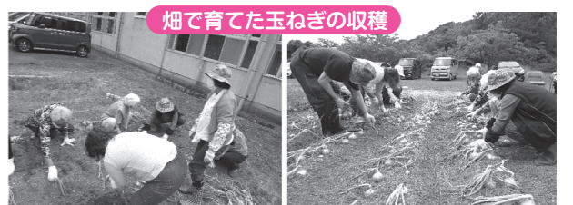
畑で育てた玉ねぎの収穫

今年はプランターでなすび、ピーマン、プチトマト、きゅうりを育てました。育てた野菜は調理して美味しく頂きました。