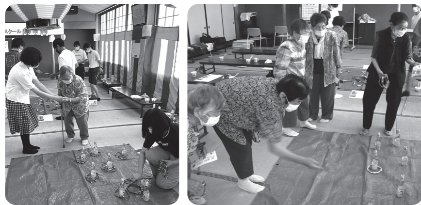
輪投げでラムネをゲット!! よーくねらってくださいね。

私は将来、介護の仕事がしたいと思っているので、このような活動ができてとてもよかったです。