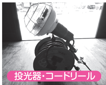
投光器・コードリール

テント 綿菓子機 ポップコーン機 かき氷機 コードリール 草刈り機 臼・杵・もち板 投光機 アンプ プロジェクター スクリーン バーベキュー用ドラム缶