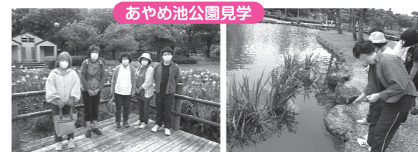
あやめ池公園見学

6月にあやめ池公園へお出かけしてあやめの花を見ながら散歩しました。池に住んでいる鯉にエサをあげると寄ってきました。