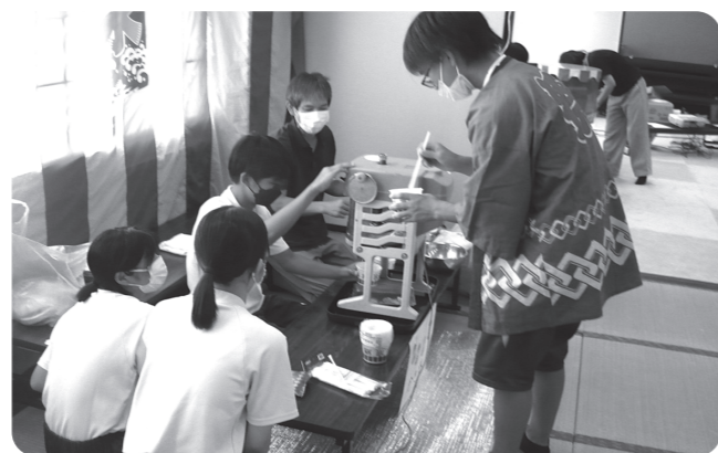
夏まつりといえば、かき氷!!