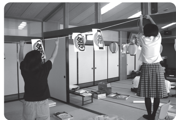
飾り付けで、だんだんお祭りの雰囲気が出てきました！

ボランティア活動をしたのは初めてだったけど、楽しくすることができたのでよかったです。コロナ関係でなかなかすることができない体験ができたのもよかったです。