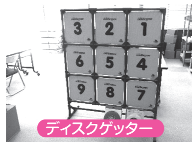
ディスクゲッター