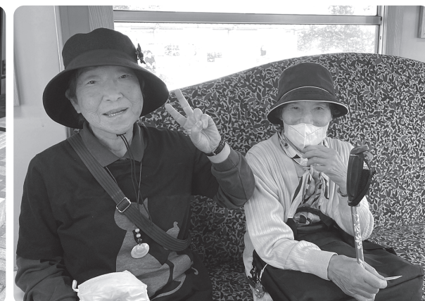
昨年の遠足の様子