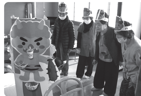
季節行事(節分)の様子

今年度からは、赤い羽根共同募金の助成を受けながら、仲間づくり、生きがいづくりを目的に、体操やレクリエーション、趣味教室、ミニ遠足などを行っています。