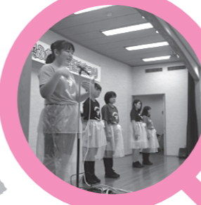
◀琴の浦高等特別支援学校によるダンスパフォーマンス