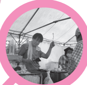
地域のボランティア団体、福祉団体によるバザーも大盛況!